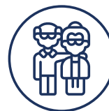
Одлазак у пензију